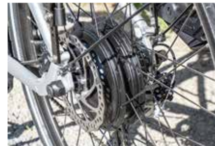
Der Nabenmotor von Bafang mit 500 Watt ist leistungsstark

Das S-Pedelec mit seinen 28-Zoll-Reifen liegt gut auf der Strasse und zeigt sich in Kurven agil und stabil. Zusammen mit der Federgabel