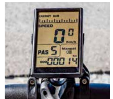
Einfach zu bedienendes und informatives Display

dämpfen die Reifen Unebenheiten gut ab. Bei schnellen Fahrten entsteht nie ein unsicheres Fahrgefühl. Die Scheibenbremsen beißen gut und bringen das Bike schnell zum Stillstand. Alles in allem ein solides und leistungsstarkes E-Bike mit einem hervorragenden Preis-Leistungs-Verhältnis. ♦